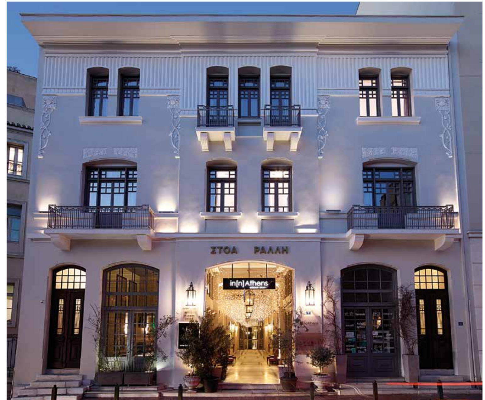
Η ΠΡΟΣΩΠΗ ΤΟΥ ΚΤΙΡΙΟΥ ΑΠΟ ΤΗΝ ΟΔΟ ΣΟΥΡΗ.

Η μελέτη των ΣΤΟΑ Studio Of Architecture αφορά στην αποκατάσταση και μετατροπή κτιρίου της μεσοπολεμικής αθηναϊκής αρχιτεκτονικής περιόδου σε μονάδα επέκτασης του ξενοδοχείου in[n]Athens. Το κτίριο, χαρακτηρισμένο ως νεότερο μνημείο, ανήκει σε συγκρότημα δύο κτιρίων, το οποίο ανεγέρθηκε το 1922 από την οικογένεια Ράλλη, για να στεγάσει εύπορους Μικρασιάτες πρόσφυγες. Τα κτίρια ενοποιούνται μέσω κεντρικού αιθρίου, το οποίο έχει πρόσβαση από τη Στοά Ράλλη.