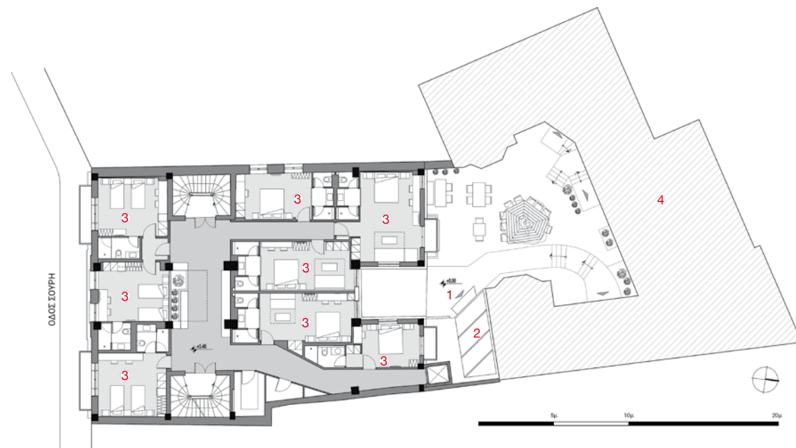
ΚΑΤΩΦΗ Α' ΟΡΟΦΟΥ