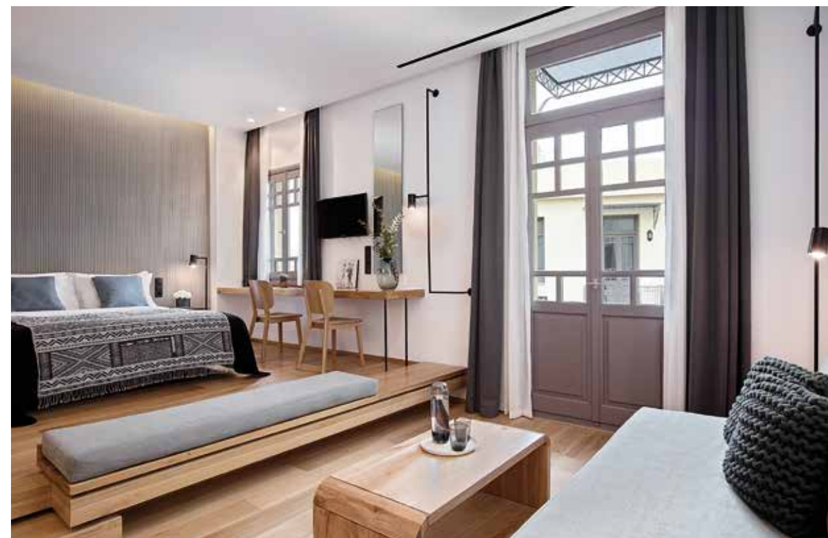
ΤΑ ΔΩΜΑΤΙΑ ΔΙΑΜΟΡΦΩΘΗΚΑΝ ΕΤΣΙ, ΩΣΤΕ ΝΑ ΑΝΑΔΕΙΚΝΥΟΝΤΑΙ ΤΑ ΙΔΙΑΙΤΕΡΑ ΜΟΡΦΟΛΟΓΙΚΑ ΣΤΟΙΧΕΙΑ ΤΟΥ ΙΣΤΟΡΙΚΟΥ ΚΤΙΡΙΟΥ.