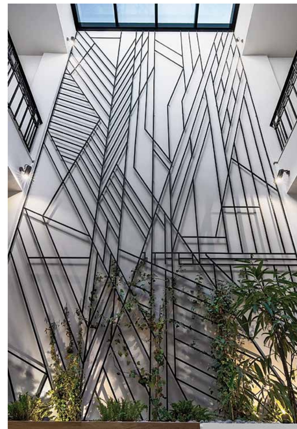
ΣΤΟ ΕΣΩΤΕΡΙΚΟ ΑΙΘΡΙΟ ΔΕΣΠΟΖΕΙ Η ΔΙΠΛΟΥ ΎΦΟΥΣ ΜΕΤΑΛΛΙΚΗ ΚΑΤΑΣΚΕΥΗ ΓΙΑ ΑΝΑΡΡΙΧΩΜΕΝΕΣ ΦΥΤΕΥΣΕΙΣ.