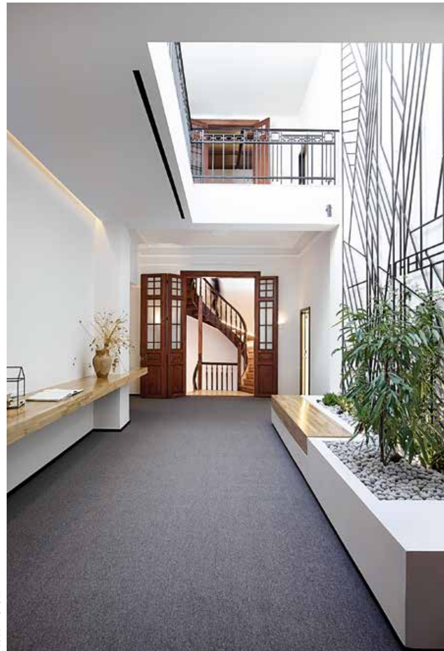
ΑΠΟΨΗ ΤΟΥ ΕΣΩΤΕΡΙΚΟΥ ΑΙΘΡΙΟΥ ΚΑΙ ΤΟΥ ΚΛΙΜΑΚΟΣΤΑΣΙΟΥ.