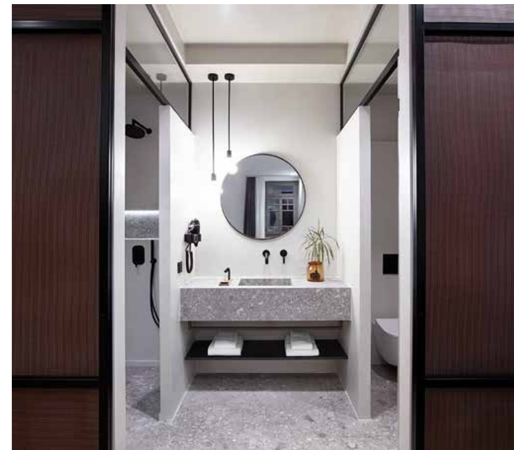
ΤΟ ΛΟΥΤΡΟ ΔΙΑΧΩΡΙΖΕΤΑΙ ΑΠΟ ΤΟ ΔΩΜΑΤΙΟ ΜΕ ΣΥΡΟΜΕΝΑ ΦΥΛΛΑ ΔΙΑΤΡΗΤΗΣ ΟΞΕΙΔΩΜΕΝΗΣ ΛΑΜΑΡΙΝΑΣ.