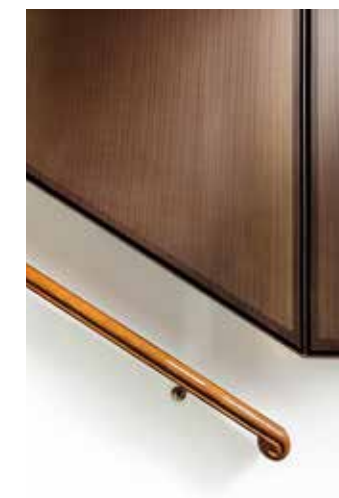
ΛΕΠΤΟΜΕΡΕΙΑ ΤΗΣ ΚΑΤΑΣΚΕΥΗΣ ΑΠΟ ΔΙΑΤΡΗΤΗ ΟΞΕΙΔΩΜΕΝΗ ΛΑΜΑΡΙΝΑ ΓΙΑ ΤΟ ΦΩΤΙΣΜΟ ΤΗΣ ΕΙΣΟΔΟΥ ΤΟΥ ΚΛΙΜΑΚΟΣΤΑΣΙΟΥ. © ΓΕΩΡΓΙΑ ΣΑΛΑΜΠΑΣΗ, ΔΗΜΗΤΡΗΣ ΜΑΟΦΗΣ