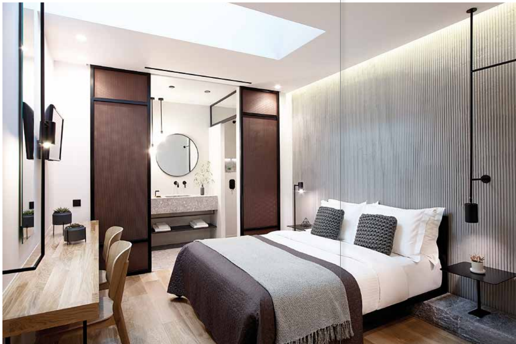
ΤΑ ΝΕΑ ΔΩΜΑΤΙΑ ΧΑΡΑΚΤΗΡΙΖΟΝΤΑΙ ΑΠΟ ΕΝΙΑΙΑ ΑΙΣΘΗΤΙΚΗ ΠΡΟΣΕΓΓΙΣΗ, ΑΛΛΑ ΔΙΑΦΕΡΟΥΝ ΩΣ ΠΡΟΣ ΤΟ ΜΕΓΕΘΟΣ ΚΑΙ ΤΗ ΛΕΙΤΟΥΡΓΙΚΗ ΤΟΥΣ ΟΡΓΑΝΩΣΗ.

Η εξοικονόμηση ενέργειας και η ελάχιστη δυνατή περιβαλλοντική επιβάρυνση αποτέλεσαν κύριους στόχους. Το κτίριο διαθέτει δύο κεντρικές μονάδες κλιματισμού VRV τελευταίας γενιάς για ψύξη - θέρμανση, οι οποίες παράλληλα κάνουν ανάκτηση θερμότητας για τη δωρεάν παροχή ζεστού νερού χρήσης. Η τοποθέτηση φωτοβολταϊκών στο δώμα κρίθηκε ασύμφορη λόγω των δύο κατά πολύ υψηλότερων όμορων κτιρίων. Επιπλέον, όλα τα φωτιστικά του καταλύματος διαθέτουν λαμπτήρες φωτοδιόδων (LED), χαμηλής ενεργειακής κατανάλωσης. Το μεγαλύτερο στοιχείο στη διαχείριση του όλου έργου βρισκόταν στην τομή μεταξύ βιωσιμότητας, αρχιτεκτονικής, κόστους και χρόνου παράδοσης. Το νέο ολοκληρωμένο in[η]Athens Hotel σχεδιάστηκε έτσι, ώστε να ανταποκρίνεται στον ολοένα και ανταγωνιστικότερο κλάδο του τουρισμού και είναι το αποτέλεσμα της άριστης συνεργασίας των συνδιοκτιτών, των αρχιτεκτόνων και της κατασκευαστικής εταιρείας, που μοιράστηκαν τις ίδιες αξίες και οραματίστηκαν ένα ξενοδοχείο διαχρονικό, με αρχιτεκτονική ταυτότητα, σεβασμό στον πελάτη και στην ιστορική αξία του κτιρίου.